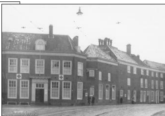
Het Militair Hospitaal aan de Fluwelen Burgwal in 1968. De ingang met de rode kruizen staat aan de Muzenstraat .