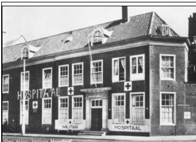
Het Militair Hospitaal in 1950. Links de Muzenstraat en rechts de Fluwelen Burgwal .

Vanaf halverwege de twintigste eeuw werden er ook burgers in het ziekenhuis behandeld en verpleegd. Aan het einde van de jaren 1960 besloot minister van den Toom van Defensie dat het hospitaal op deze plek overbodig geworden was. In 1970 werd het ziekenhuis daarom, op 26 bedden na, voor het grootste deel gesloten. Het gebouw werd in 1974 gesloopt.