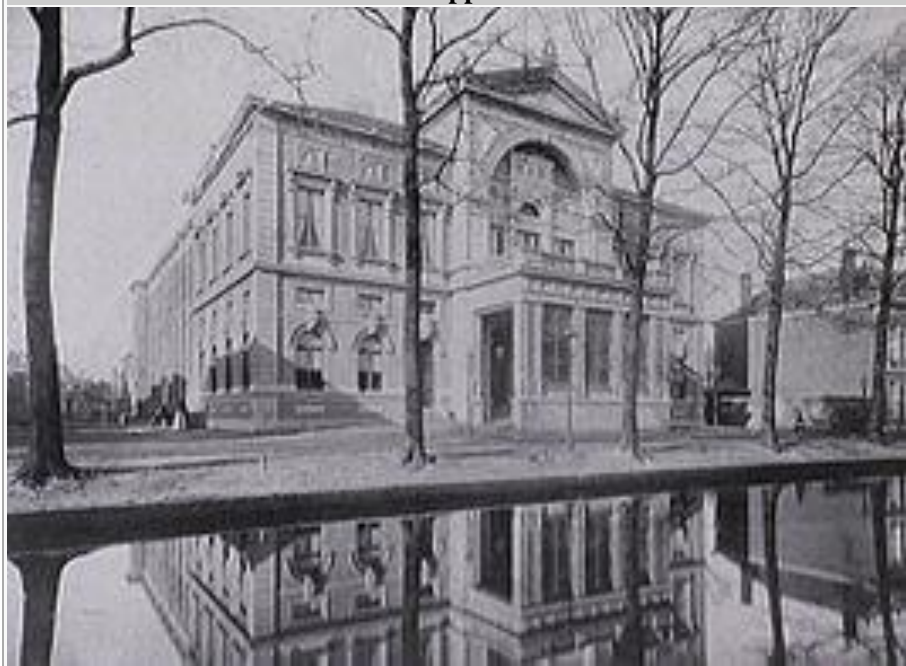
Gebouw voor Kunsten en Wetenschappen in 1980

Het Gebouw voor Kunsten en Wetenschappen was een theater-, concert- en evenementengebouw aan de Zwarteweg, hoek Muzenstraat, in Den Haag. Het werd officieel geopend op 2 december 1874 en door brand verwoest op 18 december 1964.