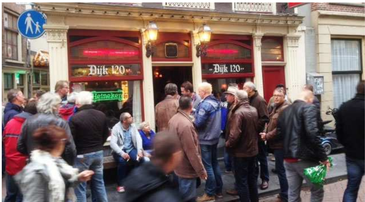
Aankomst heren bij Café Dijk 120, Zeedijk.

Na wederom een mini-cruise, dit keer de retour-oversteek van het KNSM-terrein naar de Prins Hendrikkade, wandelden de heren naar het centrum, naar café Dijk 120 aan de Zeedijk (door meerderen meermalen bezocht), waar zij om ca. 17:00 arriveerden. Ze bleken niet de enigen te zijn die dat plan hadden opgevat en met locals, voetbalfans (we spraken een groepje uit Twello dat de voetbalwedstrijd Go Ahead Eagles - Ajax in de Arena ging bezoeken) en wat onduidelijke figuren was het druk, maar gezellig. Regent Eilerts was zo aardig de groep te blijven voorzien van de door de heren gewenste versnaperingen. http://www.yelp.nl/biz/cafe-dijk-120-amsterdam