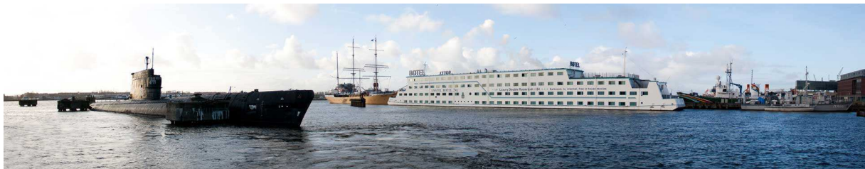
Russische duikboot en Botel in de voormalige KNSM-haven.

Opmerkelijk bouwwerken die de heren bezochten zijn bijvoorbeeld een in frisse kleuren geverfde oude scheepskraan die werd omgetoverd tot het Franda Crane Hotel met drie design hotelkamers en daarop een jacuzzi op hoog niveau, het Noorderlicht met zijn transparante golfplaten-dak, het trendy yuppen café-restaurant IJ-kantine (de voormalige KNSM-kantine), en Beachclub Pilek, dat is opgebouwd uit oude zeecontainers. Het terras van Pilek gaat over in een heus stadsstrand. In de NDSM-haven bevinden zich o.a. een Russische onderzeer uit 1956, het voormalige zendschip Veronica, een drijvend hotel, een pannenkoekenboot en soms de schepen van Greenpeace. http://www.ndsm.nl/