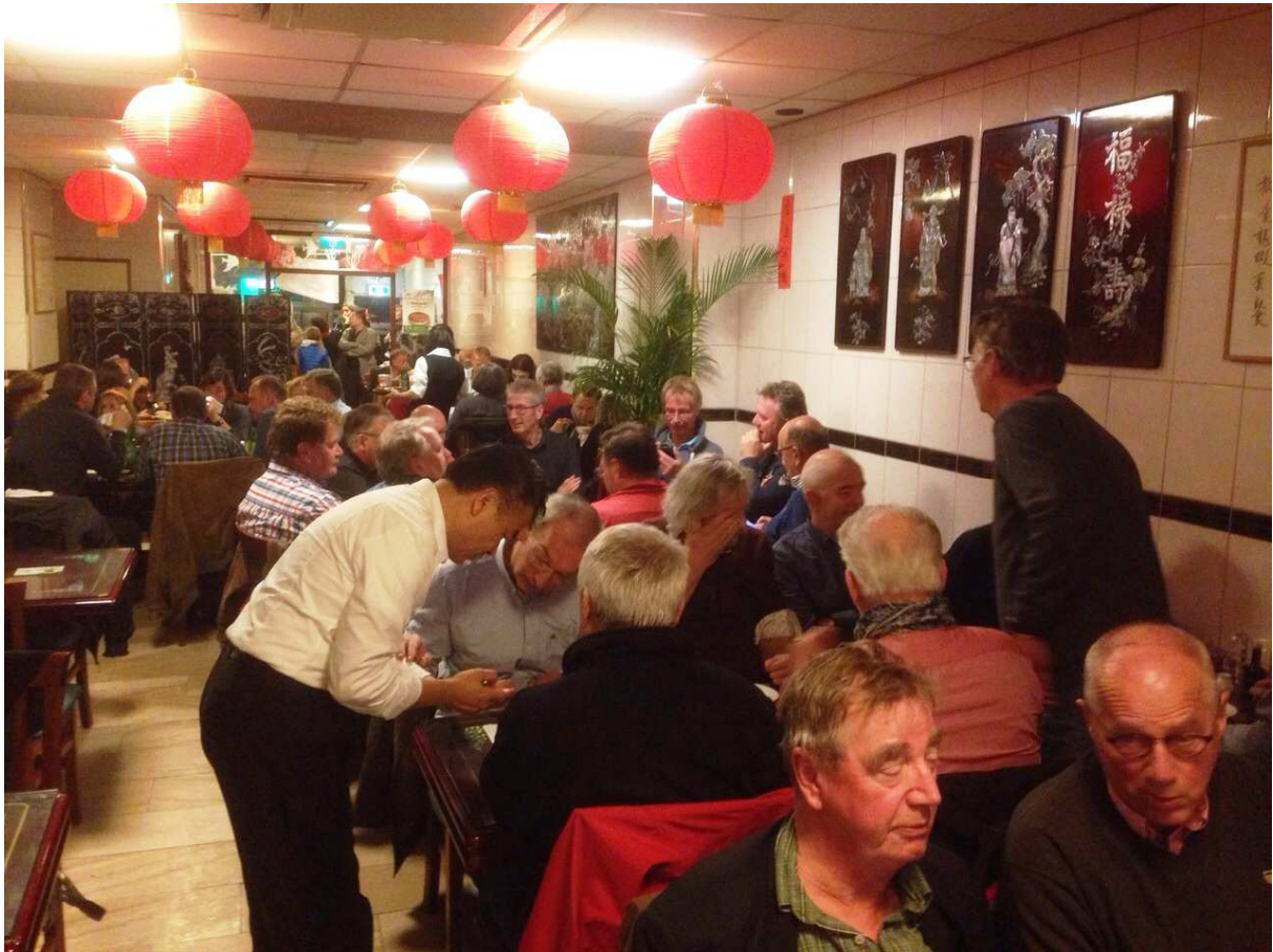
De heren bij Nam Kee.

Na ruim twee uur Dijk 120, voldoende tijd om de ergste dorst te lessen, gingen de heren om 19:15 uur, de afgesproken tijd, aan tafel bij het vermaarde Chinese restaurant Nam Kee, aan de Geldersekade. Nam Kee werd beroemd in Amsterdam en verre omstreken door met name de gestoomde oesters in zwarte bonensaus, maar wij kunnen u verzekeren dat alle gerechten dik in orde zijn. In 2013 is Nam Kee verkozen tot beste Chinese restaurant van Nederland. http://www.namkee.net/